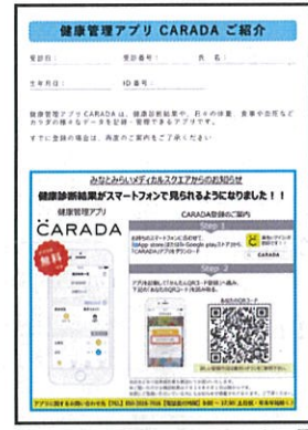
【健診結果票サンプル】