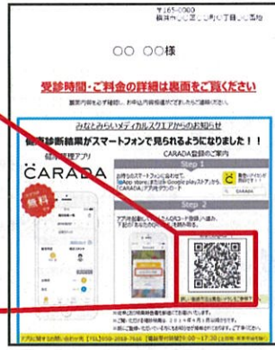
【受診案内票サンプル】